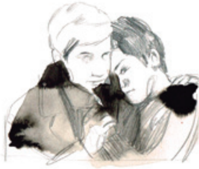
"Antoine i Colette" 1962