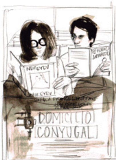
"Domicili conjugal" 1970