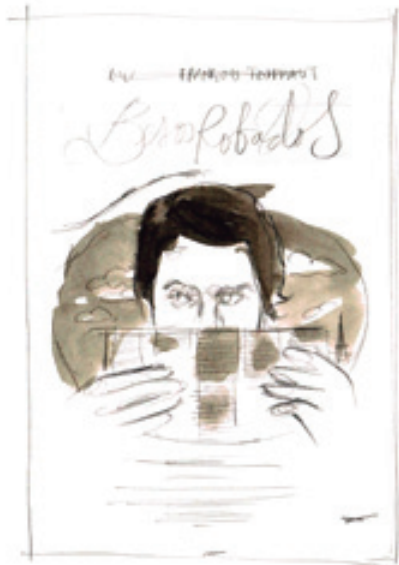
"Petons robats" 1968