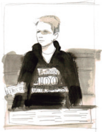
"Els 400 cops" 1959

El personatge apareix per primera vegada el 1959, a "Els 400 cops", pel·lícula que sorgeix d'una idea que anava destinada a ser un curt, "la fuga d'Antoine", un repàs de la seva adolescència allunyat de sentimentalismes. Truffaut considerava que la pubertat era un mal moment que tothom havia de passar.