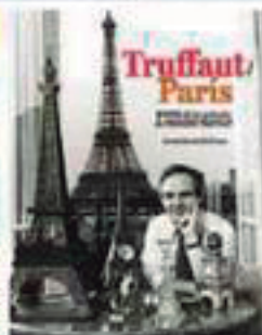
Truffaut/Paris (T&B) , d'Arturo Barcenilla Tirapu, permet localitzar al Paris d'avui la passarel·la per on corrien els personatges de Jules et Jim o l'escola de la qual s'escapava Antoine Doinel a Los 400 golpes . Mapes i fotografies per rastrejar la ficci  en la realitat.