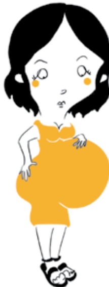
una puti barata