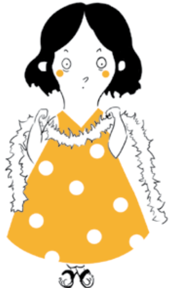
o un arbre de Nadal