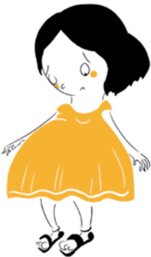
semblo una taula braser